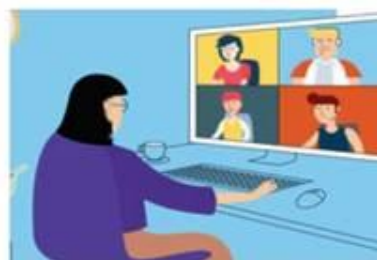
图 2 第二机位拍摄效果示意图