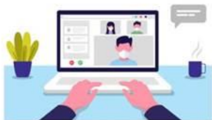
图 1 第一机位示意图

考试前按要求调试好设备，将主机位钉钉全屏显示并开启摄像头。主机位（面试机位）从正面拍摄，对准考生本人，确保考生双手和头部呈现在拍摄画面中。辅机位（监控机位）从考生侧后方 45° 拍摄，距离 1-2 米，确保辅机位能从